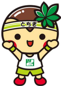
とちまるくん