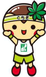
-頭身バランスの崩れ-