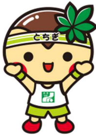
Tochimarukun