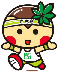
-目と口の位置の変更-